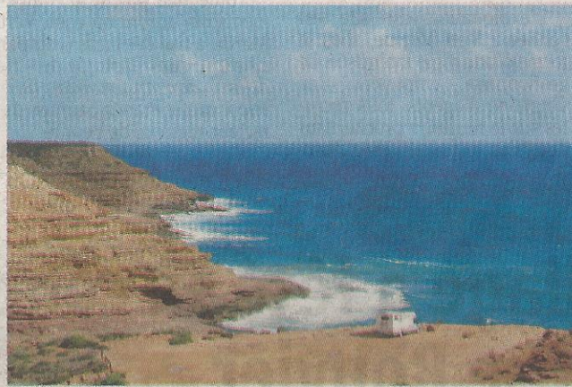
Près de Kalbarri, une ville située sur la côte ouest de l'Australie.

L'Europe, d'abord, nous a permis de nous adapter à notre nouvelle vie, à notre nouveau véhicule qui est, à la fois, notre nouvelle maison, une maison de